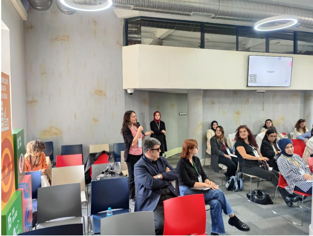
Katılımcılar görüşlerini paylaşırken