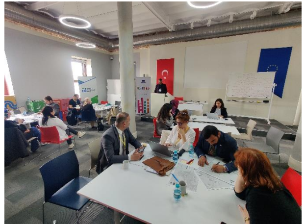
Katılımçılar masa çıktılarını sunuyor